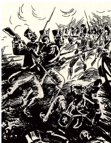
Н.В. Кузьмин «Бородино». «Рука бойца колоть устала...»

«Я думал: «Жалкий человек. Чего он хочет! Небо ясно, Под небом места много всем, Но беспрестанно и напрасно Один враждует он – зачем?»»